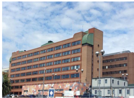
Ysbyty Brenhinol Gwent, Casnewydd

Ariennir y gwasanaeth a ddarperir yn Ysbyty Brenhinol Gwent gan Fwrdd Iechyd Prifysgol Aneurin Bevan.