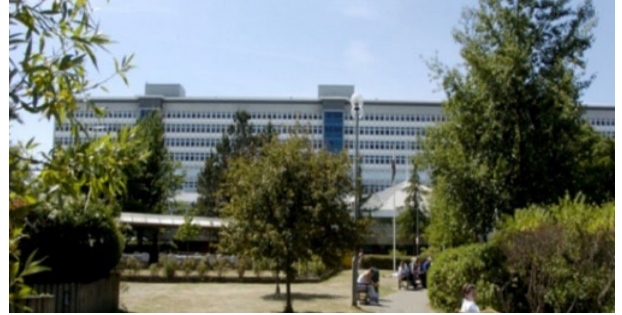
Ysbyty Athrofaol Cymru, Caerdydd

Ariennir y gwasanaeth a ddarperir yn Ysbyty Brenhinol Gwent gan Fwrdd Iechyd Prifysgol Aneurin Bevan.