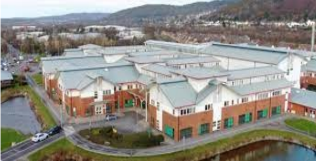
Ysbyty Castell-nedd Port Talbot, Port Talbot